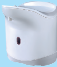
自動で出てくるモダミン